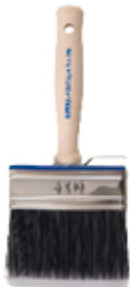
AQUAsynt Pro 500-10x3