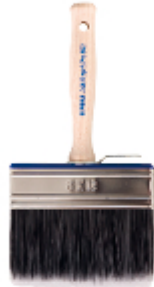
AQUAsynt Pro 500-12x3